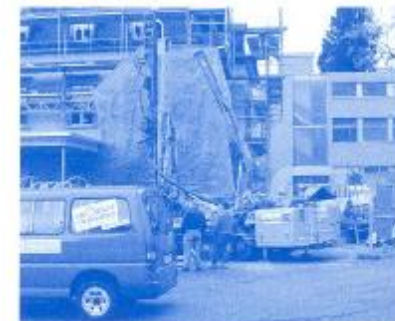
Erdsondenbohrung mit einer Tiefe von 2 x 210 Metern.

Gerne zeigen wir Ihnen unsere Referenzanlagen. (nach Voranmeldung)